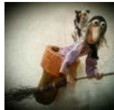
Кадр из мультфильма «Домовёнок Кузя»