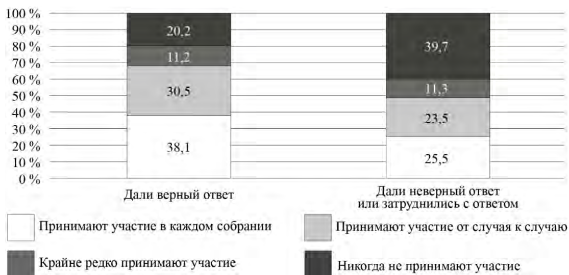
Рис. 6. Дифференциация участия собственников в ОС по знанию состава общего имущества в МКД (%)