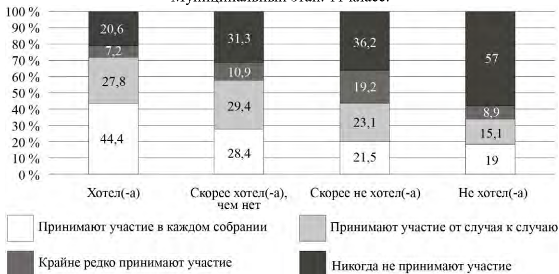
Рис. 7. Дифференциация участия собственников в ОС по желанию иметь квартиру в конкретном МКД (%)

6.1. На основании анализа диаграмм выберите верные утверждения о характеристиках регулярных участников ОС по сравнению с остальными жильцами МКД.