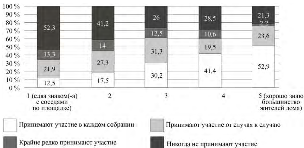
Рис. 2. Дифференциация участия собственников в ОС по степени знакомства с соседями (%)