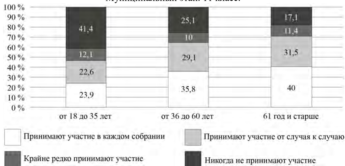
Рис. 3. Дифференциация участия собственников в ОС по возрасту (%)