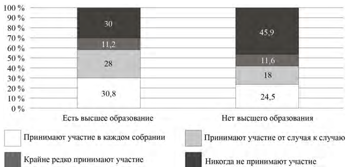
Рис. 4. Дифференциация участия собственников в ОС по образованию (%)