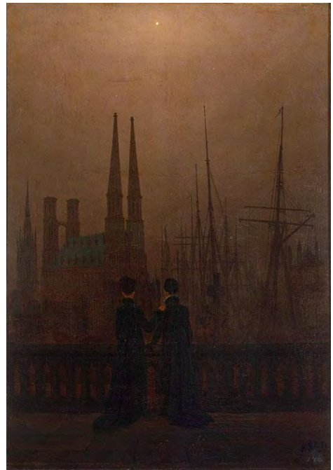
Каспар Давид Фридрих. Ночь в гавани. 1818–1820