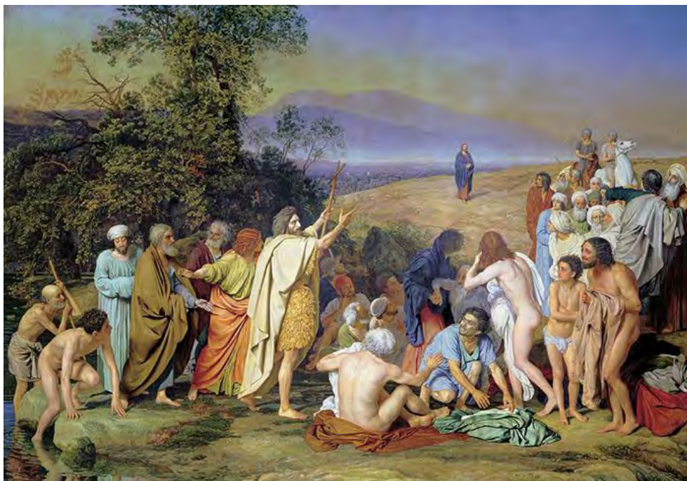
А. Иванов. Явление Христа народу. 1837–1857