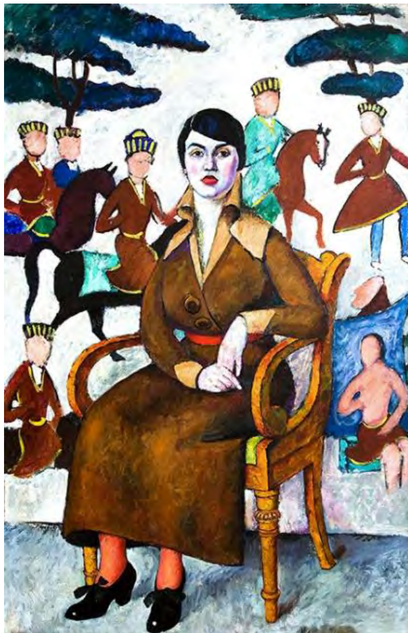
3. Илья Машков. Портрет дамы в кресле. 1913