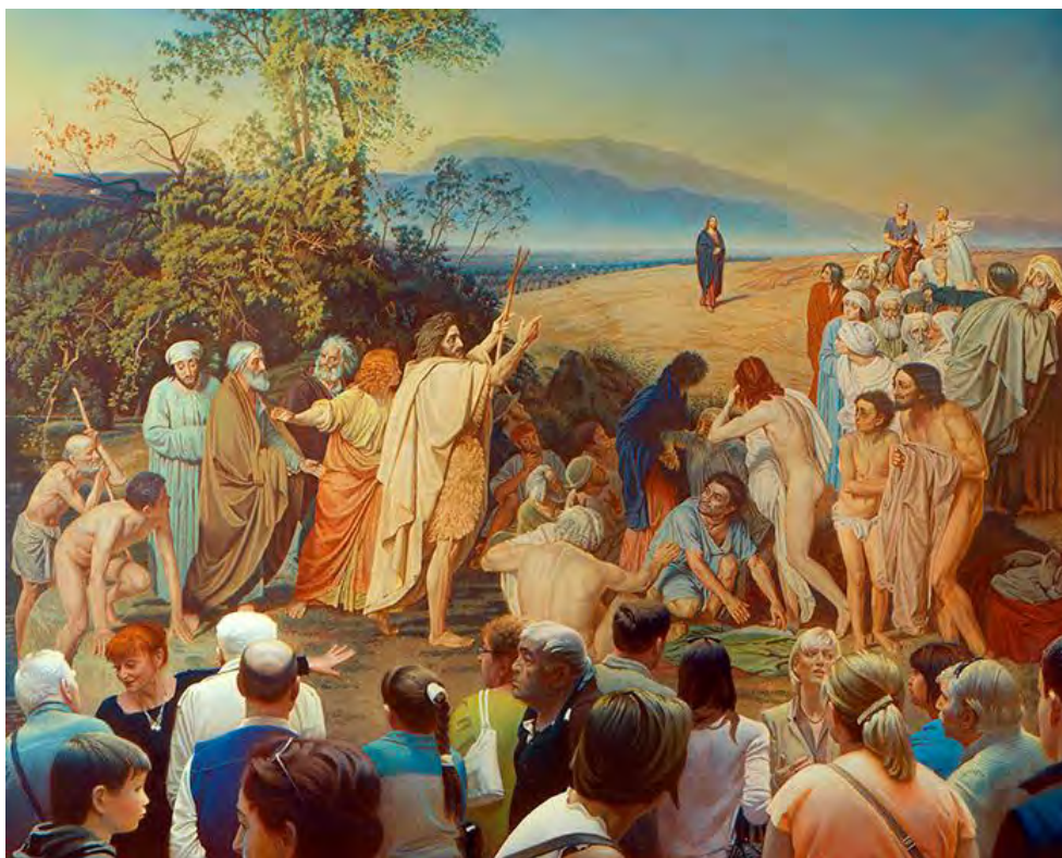
Э. Булатов. Картина и зрители. 2011–2013

К этой теме Булатов обращался не раз. Так, за несколько лет до создания картины он написал работу «Лувр. Джоконда», где главным героем стала толпа, взирающая на музейный шедевр, символ классического искусства в целом. В работу «Картина и зрители» Булатов включает произведение, ставшее своего рода иконой русской живописи постпетровского периода, – «Явление Христа народу».