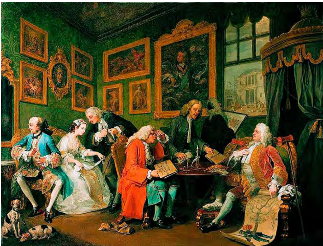
2. Уильям Хогарт. Серия «Модный брак». Брачный контракт. 1743–1745