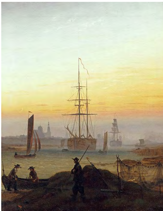
Каспар Давид Фридрих. Грайфсвальдская гавань. 1818–1820