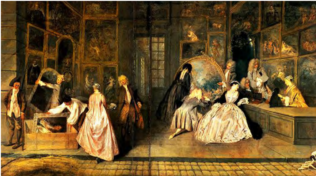
1. Антуан Ватто. Вывеска лавки Жерсена. 1720