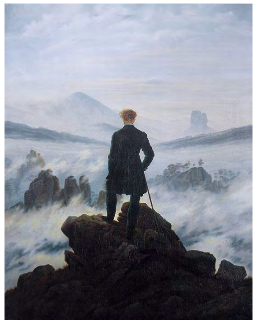
Каспар Давид Фридрих. Странник над морем тумана. 1818