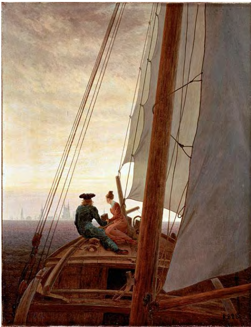
Каспар Давид Фридрих. На паруснике. 1818–1820