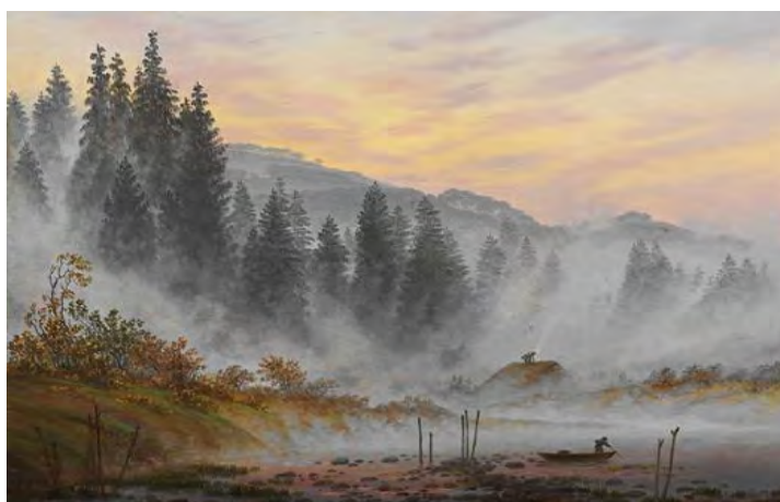
3. Каспар Давид Фридрих. Утро. 1820–1821