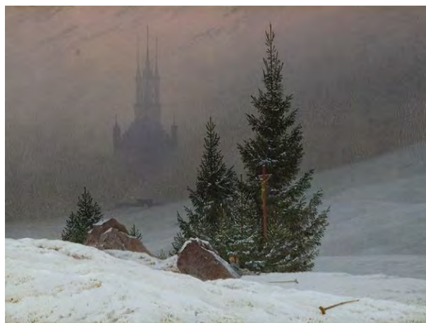
2. Каспар Давид Фридрих. Зимний пейзаж с церковью. 1811