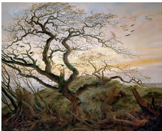
1. Каспар Давид Фридрих. Дерево с воронами; могильный курган у Балтийского моря и остров Рюген вдали, или Дерево ворон. 1822

Обратите, пожалуйста, внимание, что в задании есть дополнительные материалы: фрагменты текста шекспировской пьесы и ещё несколько работ К.Д. Фридриха. Дополнительные материалы помогут вам подумать о философских и стилистических особенностях и разнообразии сюжетов живописи немецкого художника-романтика, а фрагменты пьесы дадут возможность поразмышлять над метафорической и образной структурой шекспировского текста и балета.