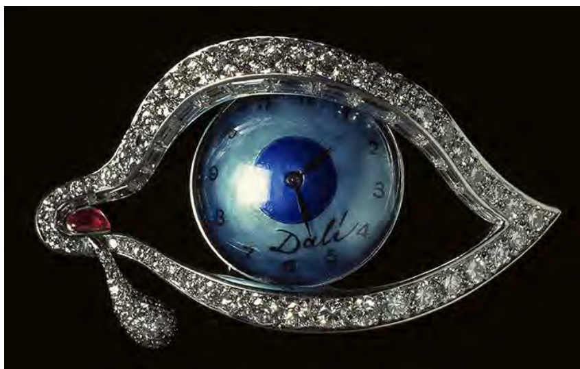
2. Брошь «Глаз времени». Сальвадор Дали, Карлос Алемани. 1949

Сравните украшения, представленные в задании. Для этого кратко сформулируйте сходства и различия в 7–10 предложениях. Обратите внимание на форму, цвет, линии, сочетание материалов, на названия украшений.