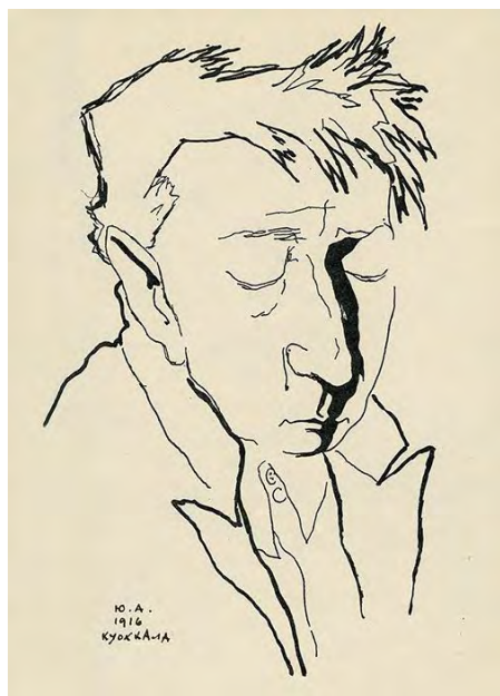
Юрий Анненков. Портрет Велимира Хлебникова (1916)

Художник, член объединения «Мир искусства», Юрий Анненков (1889–1974) в 1910–20-е годы создал целую галерею живописных и графических портретов многих политиков, деятелей искусства, литераторов. В их числе были два портрета поэтов Велимира Хлебникова и Владимира Маяковского. Позднее, уже в 1960-е годы, Анненков написал большой автобиографический труд «Дневник моих встреч» – это воспоминания об эпохе, свидетелем которой он был, и о людях, составлявших для него лицо этой эпохи. Выполняя задание, у Вас есть возможность сопоставить непосредственное впечатление, зафиксированное в графических портретах, и словесные портреты, написанные спустя продолжительное время после встречи художника с изображённым героем.