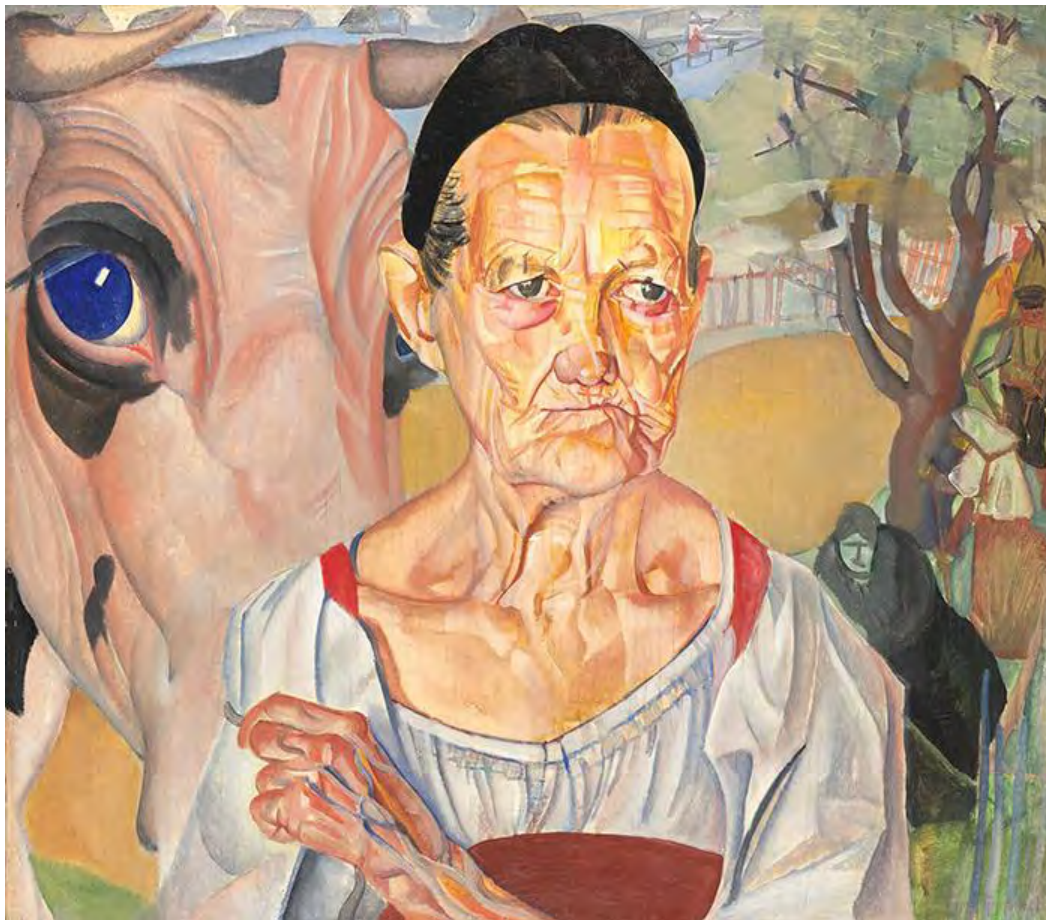
2. Б. Григорьев. Старуха-молочница. 1917 – нач. 1920-х гг.

Посмотрите на представленные работы и подумайте об их сходствах и различиях.