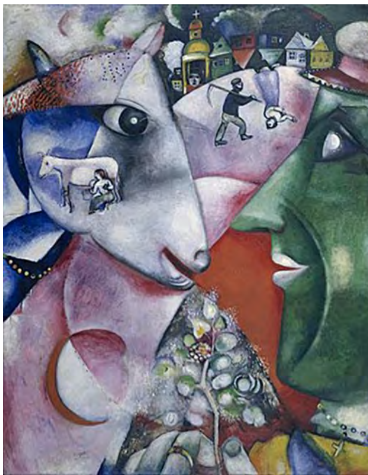
1. М. Шагал. Я и деревня. 1911

Работа «Старуха-молочница» входит в цикл «Расея», созданный Григорьевым в 1917 – начале 1920-х годов. Этот цикл писался художником в разгар страшных событий в истории страны – гражданской войны и революции. Григорьев работал над ним в Санкт-Петербургской и Олонецкой губерниях, где сохранился не только патриархальный уклад жизни, но и острая связь с другим периодом гражданской смуты – временем церковного раскола, поскольку в эти места был сослан протопоп Аввакум.