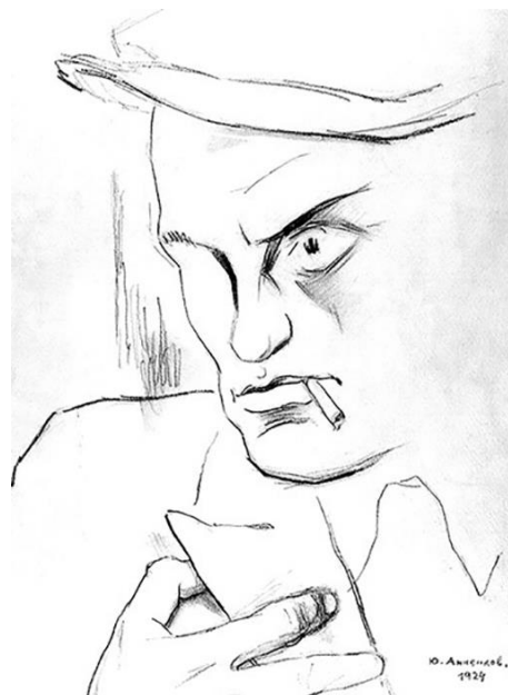
Юрий Анненков. Портрет Владимира Маяковского (1924)