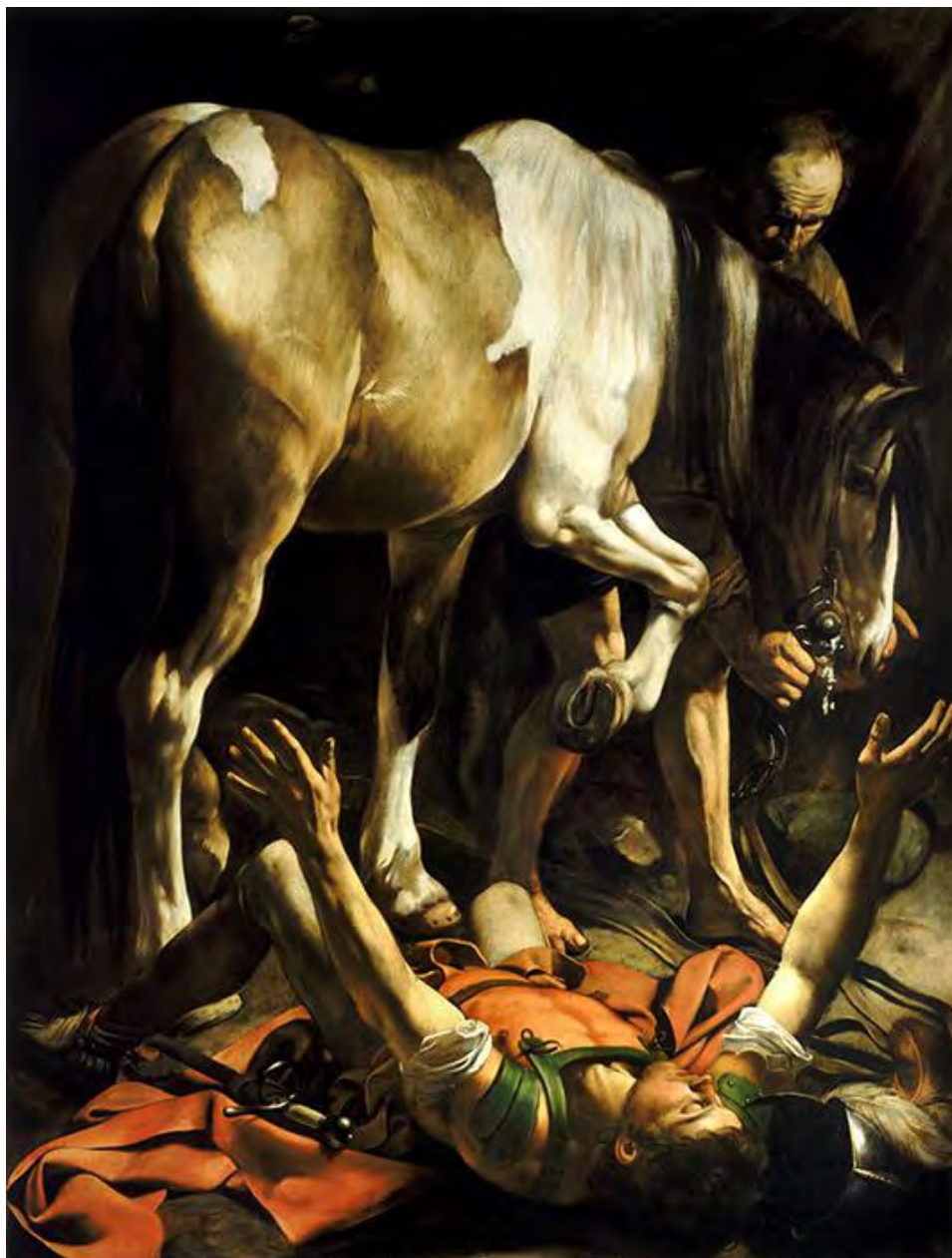
Микеланджело да Караваджо. Обращение Савла. 1601.

Внимательно посмотрите на картину Караваджо.