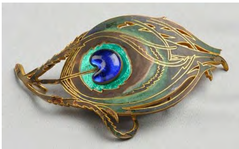
1. Пряжка «Павлиний глаз». Пиль Фререс. Начало XX века

В задании представлены два ювелирных изделия, выполненные в форме глаза. Пряжка «Павлиний глаз» сделана в начале XX века в стиле модерн французским мастером Пилем Фрересом. Он использовал для своей вещи достаточно дешёвые материалы: полихромную эмаль, синее стекло и позолоченный металл. Брошь «Глаз времени» исполнена ювелиром Карлосом Алемани в 1949 году по эскизам Сальвадора Дали. Знаменитый художник реализовал себя и в области декоративно-прикладного искусства – по его эскизам выполнено в общей сложности 37 ювелирных изделий. Для этой брошки были выбраны очень дорогие материалы – платина, бриллианты и рубин, только глазное яблоко выполнено в синей эмали.