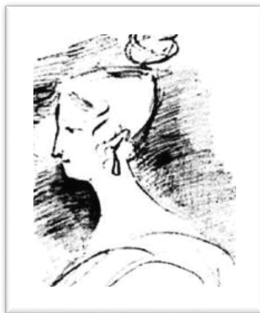
Рисунок А.С. Пушкина, изображающий Е.К. Воронцову

(одно из 30 изображений, выполненных А.С. Пушкиным)