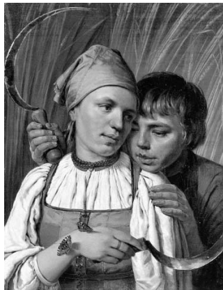
Алексей Венецианов «Жнецы»

2.1. Из представленных ниже репродукций картин выдающихся русских художников выберите ту, на которой изображено протекание химической реакции.