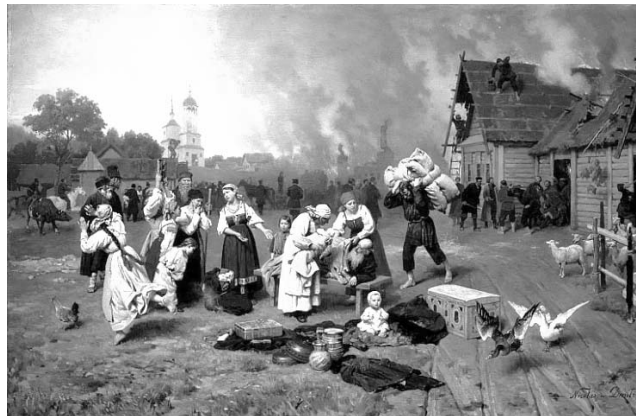
Николай Дмитриев-Оренбургский «Пожар в деревне»