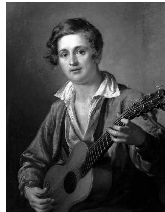
Василий Тропинин «Гитарист»