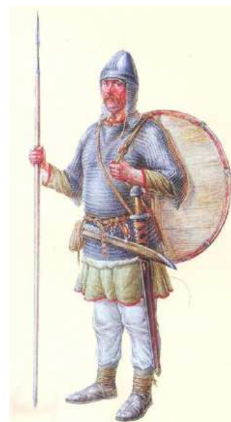
Пеший воин, X в.

передвижение в те времена было опасным, поскольку дорога шла через глухой лес, где изобиловали хищники и могли встретиться «лихие люди». Тогда как по рекам можно было перемещаться без каких-либо затруднений.