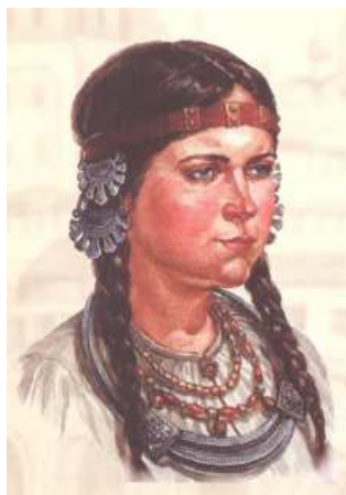
Девушка из рода вятичей, X в.

VIII–IX вв. – на берегах рек Оки, Москвы, Клязьмы поселилось славянское племя вятичей. Для одной из своих стоянок избрали они высокий холм на берегу Москвы-реки, там, где в неё впадают воды Неглинной. Холм был покрыт лесом, на сухом песчаном взгорье росли высокие и крепкие боровые сосны. На мысу поставили укреплённый город. Сейчас его никто так не назвал бы, но по тогдашним понятиям это был настоящий город.