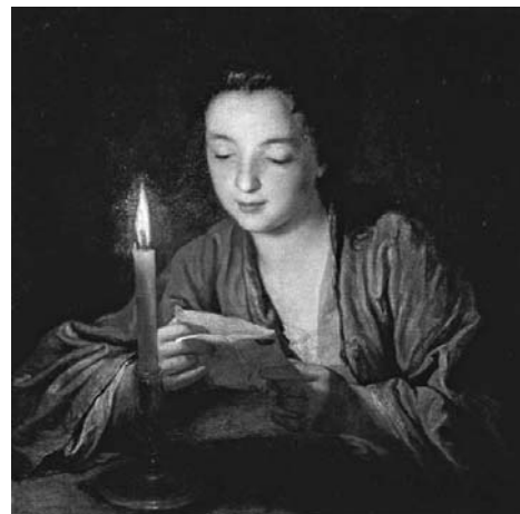
Жан-Батист Сантерр «Девушка со свечой» Рис. 3

Протекание химической реакции изображено на рисунке: