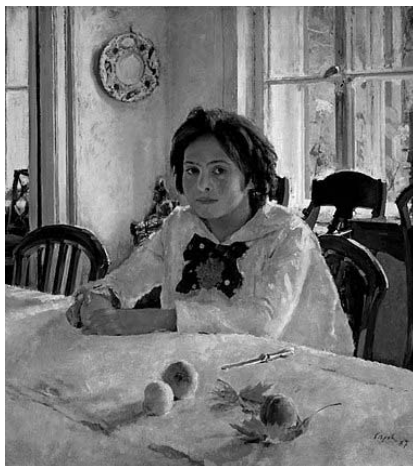
Валентин Серов «Девочка с персиками» Рис. 2