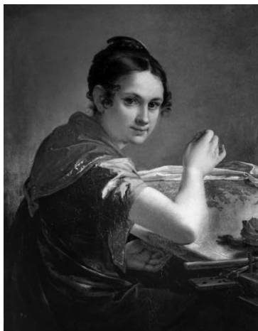
Василий Тропинин «Золотошвейка» Рис. 1

2.1. Из представленных ниже репродукций выдающихся произведений мировой живописи выберите ту, на которой изображено протекание химической реакции.